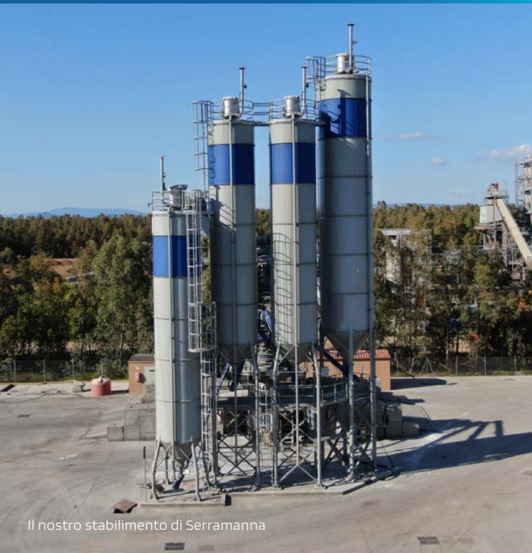
Il nostro stabilimento di Serramanna