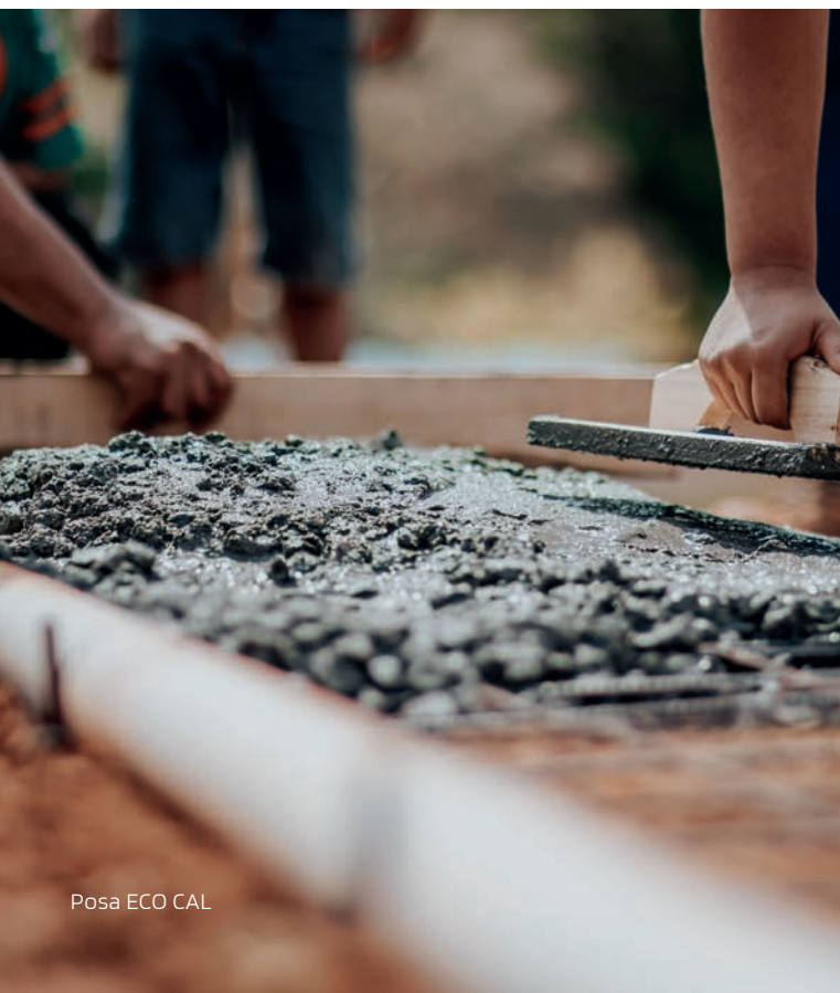
Posa ECO CAL

Le consegne del prodotto sono puntuali ed eseguite con le modalità concordate con il cliente. La ECO CONGLOMERATI , instaurato il rapporto di vendita, avvia in collaborazione con tutti i componenti del suo team una costante attività di controllo della qualità, garantendo la completa soddisfazione del cliente.